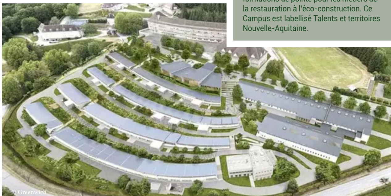
Plan de la restructuration des ateliers existants et construction d'un tiers-lieu au lycée des Métiers du bâtiment de Felletin

La Région a été à l'initiative de la création du Campus régional du patrimoine bâti, basé à Felletin (23) qui développe des formations de pointe pour les métiers de la restauration à l'éco-construction. Ce Campus est labellisé Talents et territoires Nouvelle-Aquitaine.