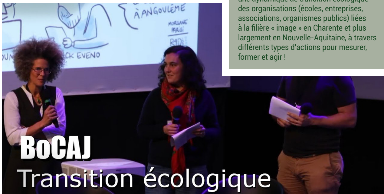
Intervention de l'association BOCAJ pendant les RADI-RAF 2023

L'association BoCAJ (Bouleversement Carbone dans l'Animation et le Jeu vidéo) a pour but de mettre en place et d'animer une dynamique de transition écologique des organisations (écoles, entreprises, associations, organismes publics) liées à la filière « image » en Charente et plus largement en Nouvelle-Aquitaine, à travers différents types d'actions pour mesurer, former et agir !