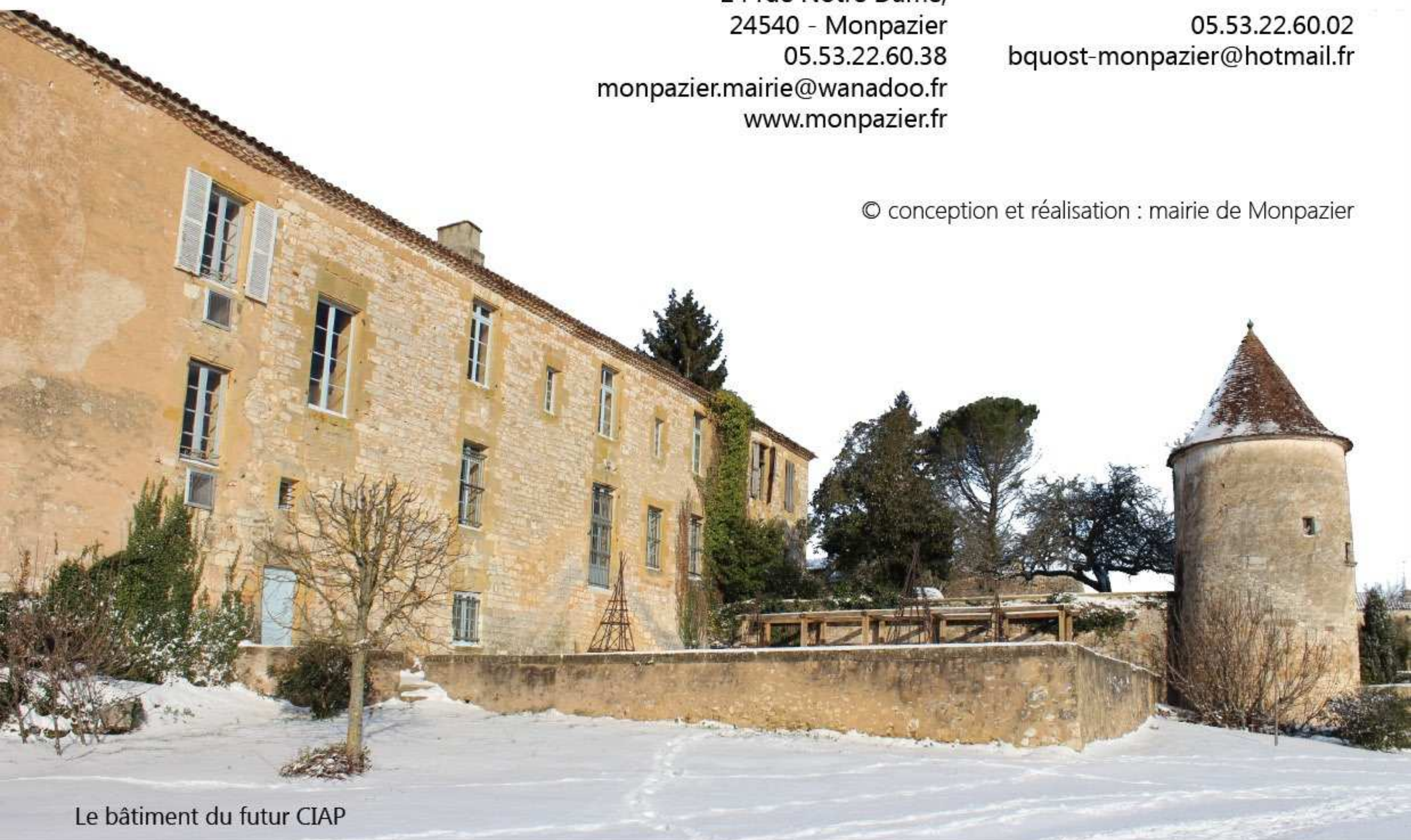
Le bâtiment du futur CIAP

© conception et réalisation : mairie de Monpazier